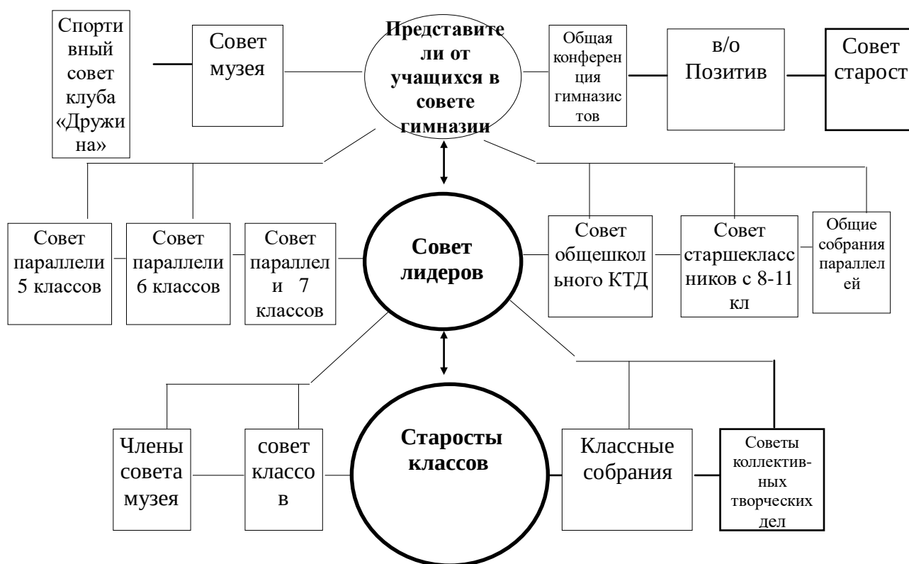
Схема самоуправления гимназистов

Организация работы по всем этим направлениям пронизывает семь основных подсистем: